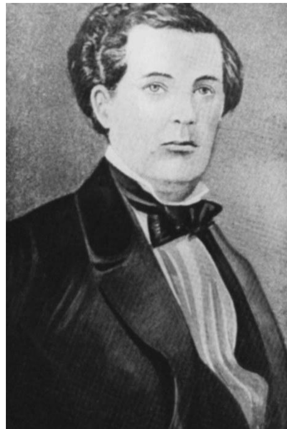
С.С.Гулак-Артемовский, композитор и певец (дядя)