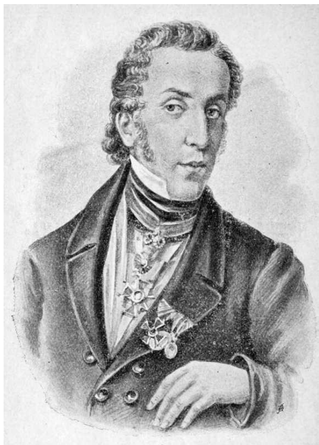
П.П. Гулак-Артемовский, писатель, ректор университета (дед)